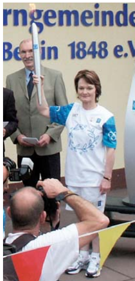
Karin Büttner-Janz gehörte am 30. Juni 2004 zu den 120 Fackelläufern, die das Olympische Feuer durch Berlin trugen.

Die Olympischen Spiele in Athen haben es dem Sport-Zuschauer mal wieder so richtig bewusst gemacht. Die Deutschen, dank „Turnvater“ Friedrich Ludwig Jahn so etwas wie die Erfinder einer ganzen Sportart, spielen in derselben keine Rolle mehr. Je weniger sich in der Gegenwart bewegt, umso stärker wird die Erinnerung an jene Ausnahmeathleten von einst, die auf der internationalen Bühne den Ton mitangaben und bestimmten. Bei den Männern waren Klaus Köste, Roland Brückner und zuletzt noch Andreas Wecker 1996 Olympiasieger, bei den Frauen sorgten Erika Zuchold, Karin Janz, Maxi Gnauck oder Dörte Thümmel - um nur wenige Beispiele zu nennen - für Schlagzeilen und einen deutlich messbar größeren Stellenwert des Turnens in der öffentlichen Wahrnehmung als heute.