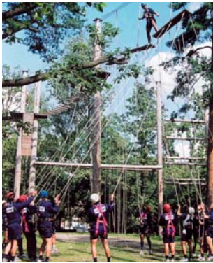
Das Team an der Flying Bridge

In der Bildungsstätte der Sportjugend Berlin absolvierten in der letzten Juliwoche die Profis von Hertha BSC ein ganz besonderes Training: sie übten im Seilgarten der Sportjugend auf dem Gelän-